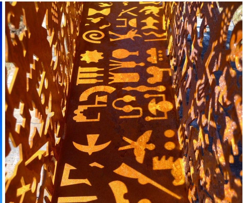
Chexbres, Schweiz 2019