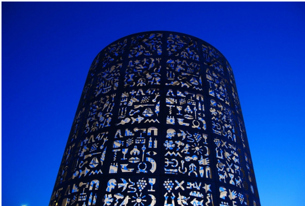
Shabo, Ukraine 2009

Video FARO https://www.youtube.com/watch?v=FOe3vDP9j3s