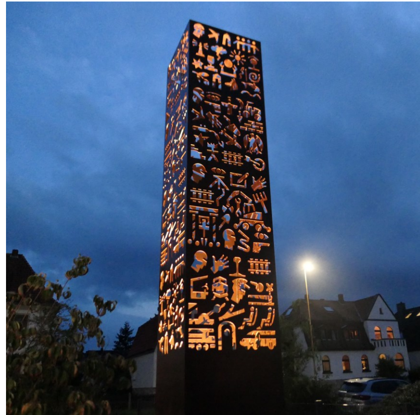
MTB – Faro, Nordstemmen D, 2023