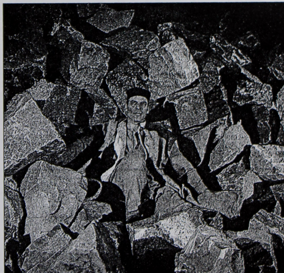
Das Gilgamesch-Epos ist uralt, fast so alt wie die Steine im Steinbruch Guber.

► Verpflegung: Vor und nach der Aufführung wird im Restaurant Guber eine einfache Mahlzeit serviert.