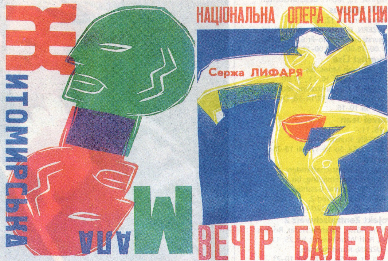
Bild aus dem Kiewer Journal, 12-teilige Arbeit, 1995, Linolschnitte und Typografie.