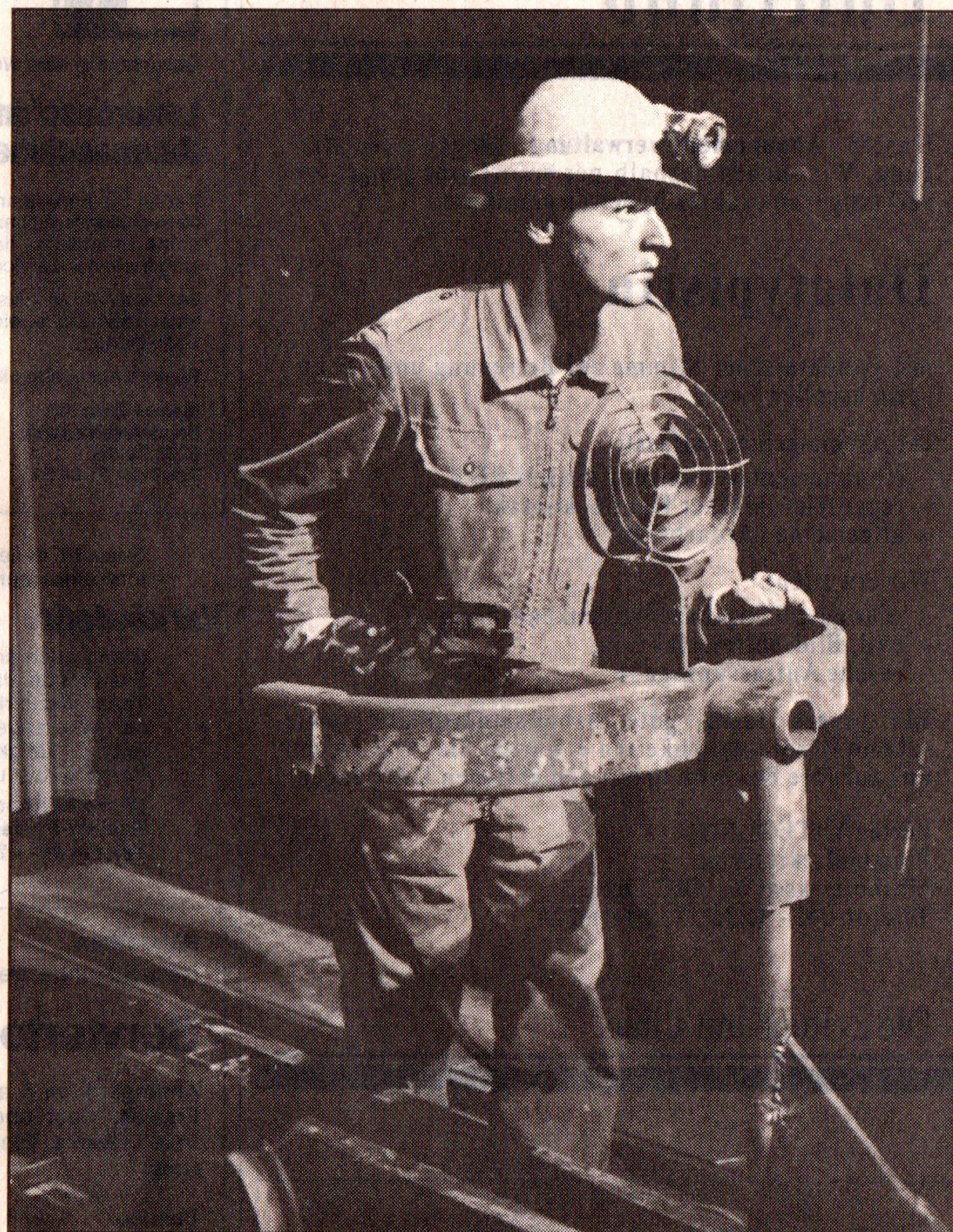
Die Schauspieler agierten mit schweren Eisenkarren, die von Szene zu Szene verwandelt wurden.

Ein eigentliches Augentheater war das, bei dem ob der Bekanntheit des Stoffes auf den Text ohnehin beinahe hätte verzichtet werden können. Die wichtigsten Szenen wurden trotzdem gesprochen. Der Rütlichswur steigerte sich mit viel Pathos zu einer religiösen Beschwörung mit Orgelklängen. Die Apfelschusszene (der eigentliche Schuss wird ausgespart) gewinnt ihre Eindringlichkeit durch die verfremdete Stimme des Landvogts. Auch der Gesslermord wird symbolisch dargestellt, indem ein kleines Holzpferd zu Boden fällt, während der Tyrann weggeschoben wird. Obwohl auf der Bühne direkt weder gefochten noch gekämpft oder geschlachtet wird, baut sich aus diesen Szenen von Mensch, Figuren und abstraktem Material zusammen mit der Musik eine gewaltsame Atmosphäre auf, eine Enge auch, aus der man sich befreien muss.